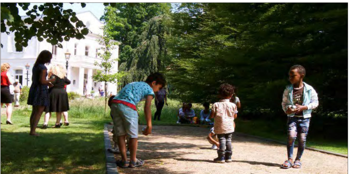
Kinderen uit het AZC, spelend tussen de concerten door

Het was wederom een zeer geslaagd weekeinde. We zijn ontzettend dankbaar voor de fondsen die dit festival financieel gesteund hebben. We hebben een groot publiek weten te bereiken, tijdens de concerten zat de zaal overvol. Naast de reguliere bezoekers ging er speciale aandacht naar het uitnodigen van ouderen uit verzorgingstehuizen en families uit het AZC Zeist. Voor deze families hebben we een bus gehuurd waardoor ze tot aan de voordeur afgezet konden worden.