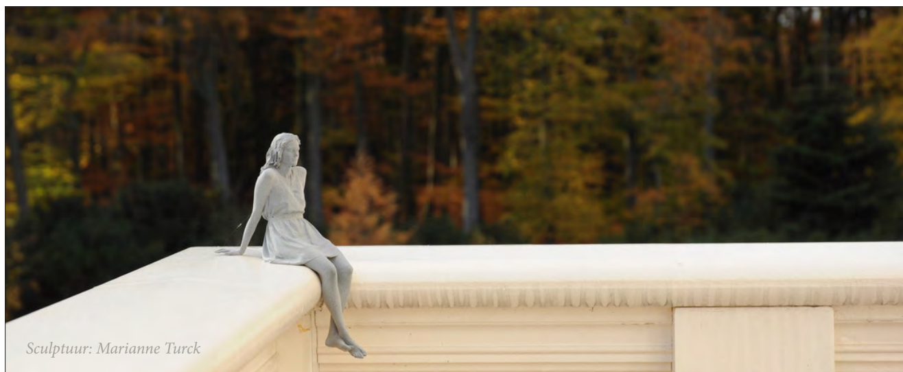
Sculptuur: Marianne Turck

De volledige statuten en het beleidsplan van de stichting vindt u terug op www.hermanvanveenartscenterfonds.com .