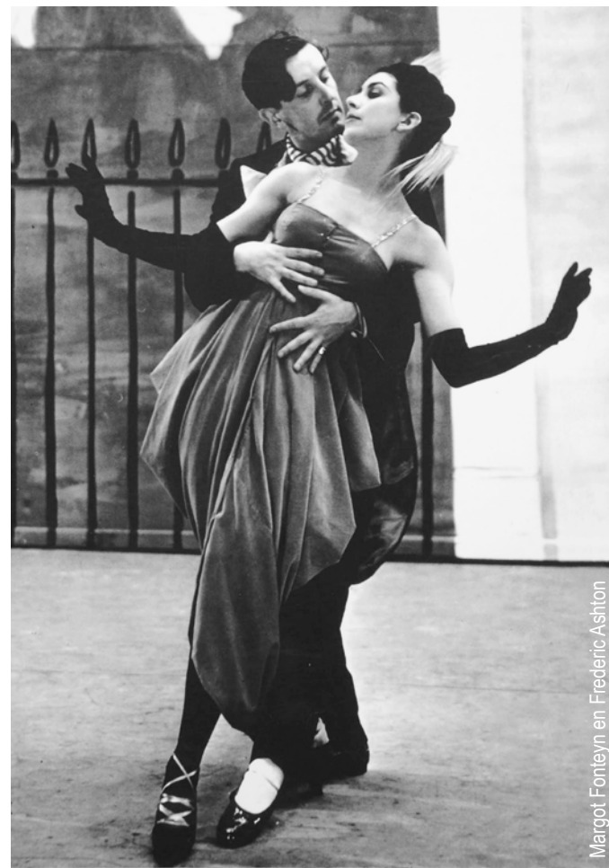
Margot Fonteyn en Frederic Ashton